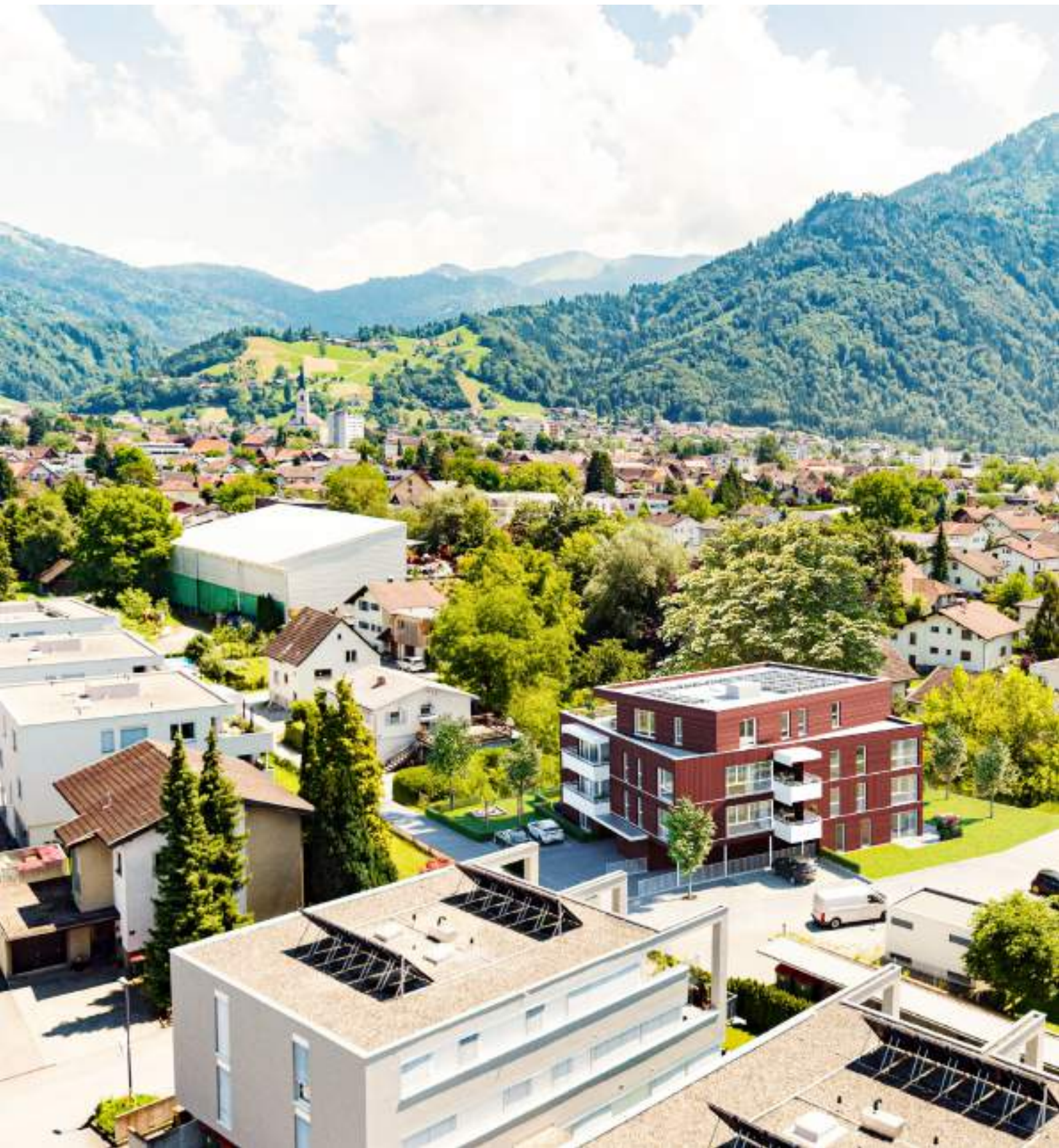
Wohnanlage Thomasbündt Dornbirn