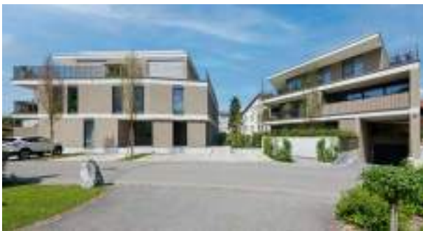
Wohnanlage Möslestraße | Altach