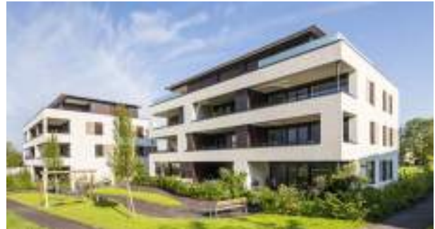
Wohnanlage Kolbendorf | Dornbirn