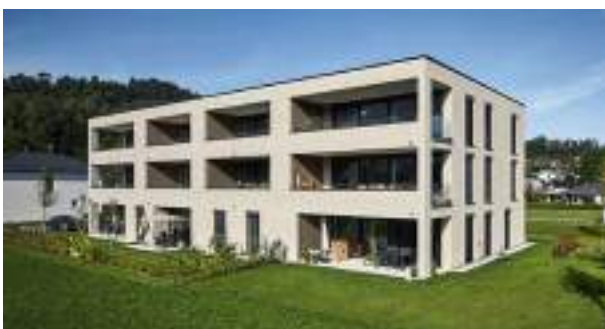
Wohnanlage Schregenbergsstraße | Feldkirch