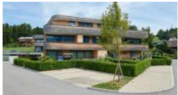
Wohnanlage Farnach | Bildstein