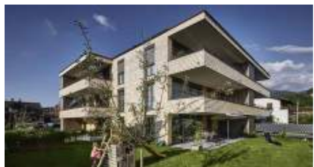
Wohnanlage Sonnengasse | Dornbirn

Unsere Kompetenz liegt in der Konzeption und Umsetzung von nachhaltigem Wohnbau in bewährter Ländle Qualität. Das Ziel ist hochwertige Lebensräume mit hoher Energieeffizienz zu schaffen, in denen sich die BewohnerInnen rundum wohlfühlen. Dabei setzen wir auf die bewährte Massivbauqualität der Winsauer Bau mit über 65 Jahren Bauerfahrung.