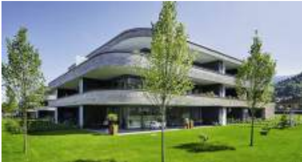
Wohnanlage Zieglergasse | Dornbirn